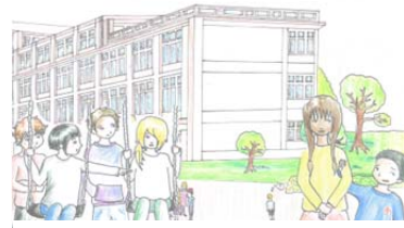
Ein Projekt des Aktionsbündnis Britz